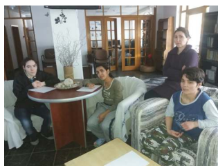
Centrul de Tranzit din Popești Leordeni – 16 locuri

După succesul înregistrat la Satu Mare cu programul Foyer, care de 14 ani oferă șansa unui nou început tinerilor aflați în dificultate, al doilea centru de tranzit împlineste un an de funcționare în Popești-Leordeni, iar al treilea centru, în Suceava, își deschide porțile pentru tineri în 2017.